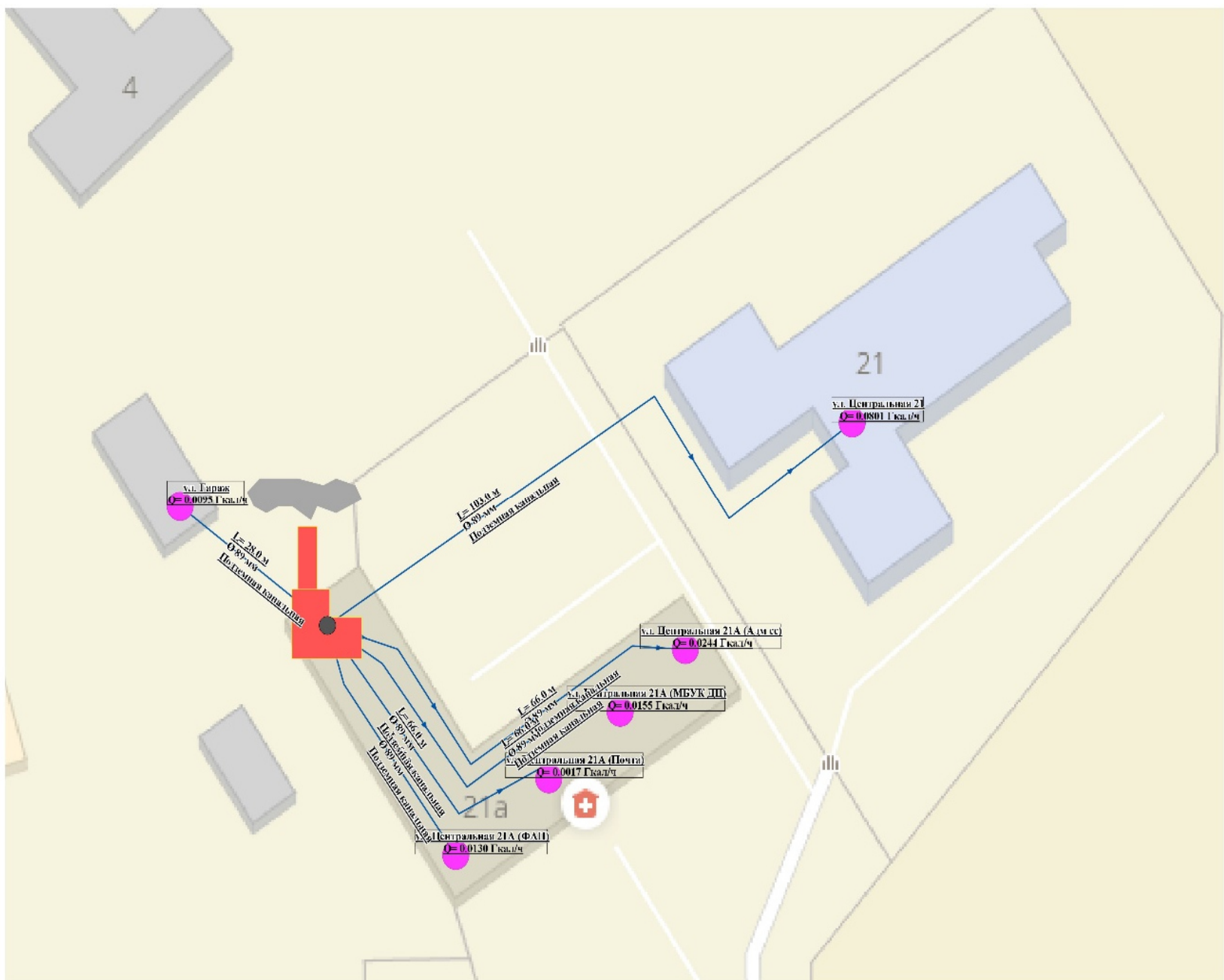
Рисунок 6 Схема тепловых сетей котельной с. Усть-Чём